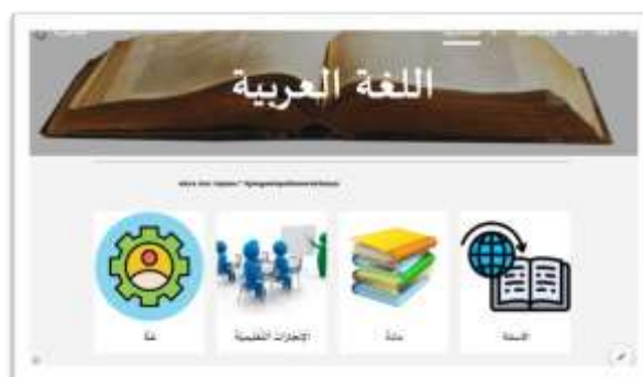
Gambar 6. Tampilan awal platform

Pada tampilan awal ini terdapat halaman awal sebagai berikut: