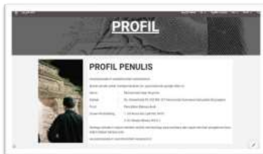
Gambar 7. Tampilan profil pengembang