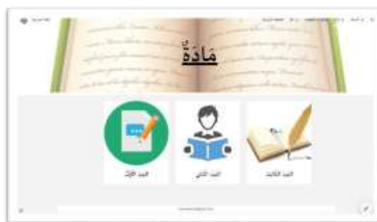
Gambar 9. Tampilan menu materi

Dengan demikian, melalui menu “مادة” pada platform e-learning ini, peserta didik dapat mengakses seluruh materi pembelajaran secara terstruktur mulai dari teks bacaan hingga daftar mufrodat sehingga mendukung proses pembelajaran mandiri dan peningkatan kompetensi berbahasa Arab secara berkelanjutan.