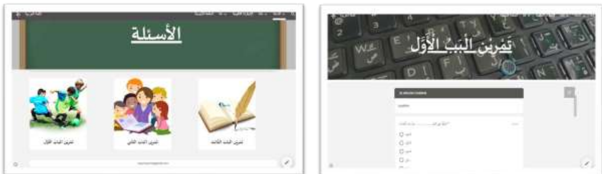
Gambar 11. Tampilan menu latihan soal

Pada tahap pengembangan, dilakukan validasi kelayakan produk oleh tim validator multidisipliner terdiri atas ahli media, ahli materi, dan ahli pembelajaran menggunakan instrumen penilaian berbasis kriteria kelayakan konten, antarmuka, dan pedagogis. Tujuan evaluasi ini adalah memastikan bahwa platform e-learning memenuhi standar mutu untuk digunakan sebagai media pembelajaran. Hasil evaluasi menunjukkan bahwa validator media memberikan skor 89 (dari maksimum 100), validator materi memperoleh skor 92, dan validator pembelajaran juga memberikan skor 89. Semua skor tersebut melebihi ambang kelayakan 75, sehingga hanya memerlukan penyempurnaan minor sesuai masukan para ahli.