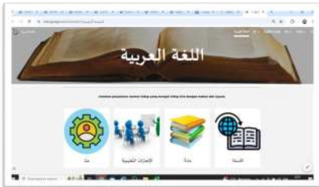
Gambar 3. Menu capaian pembelajaran