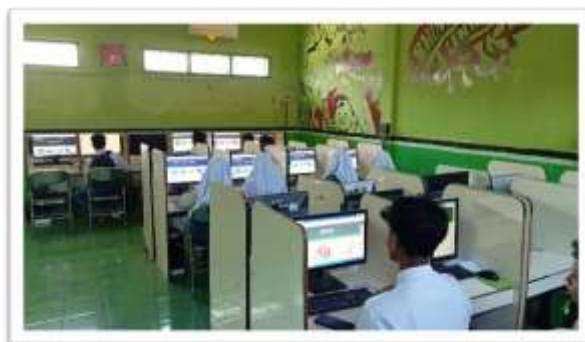
Gambar 12. Peserta didik kelas XII IPS sedang menggunakan platform e-learning

Setelah memperoleh validasi dari beberapa ahli dan media dinyatakan layak, peneliti melaksanakan pre-test terlebih dahulu untuk mengevaluasi kemampuan awal siswa. Selanjutnya, platform e-learning diterapkan kepada siswa kelas XII IPS di MA Al Abror Sukosewu, yang kemudian diikuti dengan pemberian post-test. Selain itu, peneliti juga membagikan angket kepada siswa untuk mengukur seberapa menarik media pembelajaran yang dikembangkan. Berikut beberapa gambarnya: