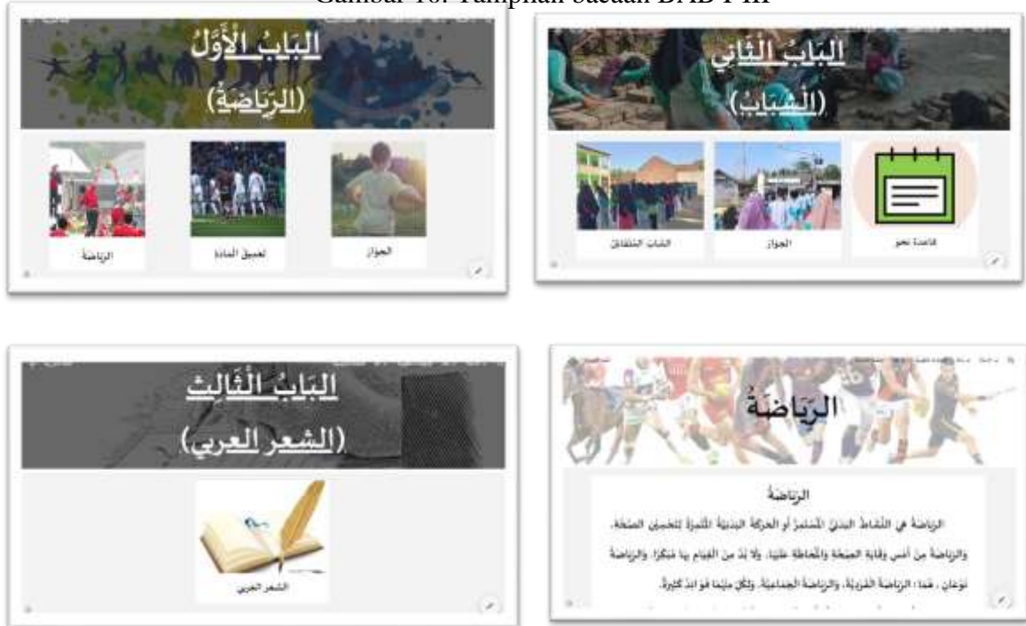
Gambar 10. Tampilan bacaan BAB I-III

Mulai dari BAB I-III, maka tampilan materi akan muncul dan memuat teks bacaan dan mufrodatnya yang akan dipelajari. Berikut gambarnya: