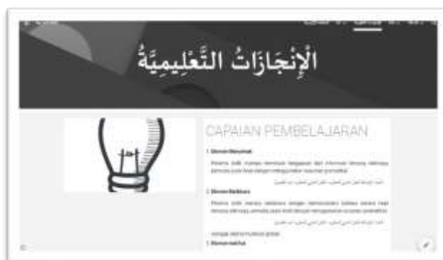
Gambar 8. Tampilan menu capaian pembelajaran

Untuk menuju ke CP, peserta didik dapat meng klik menu “الإنجازات التعليمية” pada halaman platform e- learning ini. Berikut gambarnya: