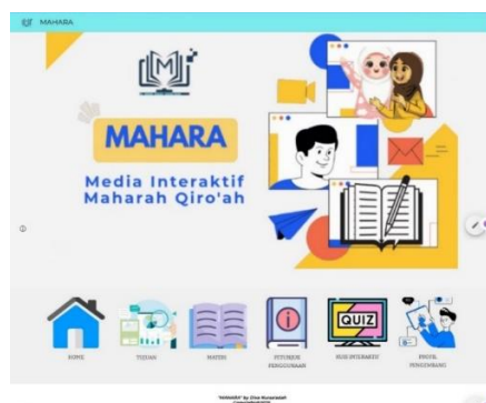
Gambar 2. Tampilan Media "MAHARA"

Kemudian di bagian halaman kuis interaktif berbasis game di WordWall yang tersedia kuis berupa soal pilihan ganda, essay , dan mencocokkan yang dapat mengevaluasi kemampuan mahasiswa dalam memahami teks-teks Maharah Qiro'ah . Butir-butir soalnya berupa menanyakan isi pokok dari teks, terjemahan teks, hingga menentukan unsur-unsur dari susunan kalimat pada teks. Menu terakhir yaitu menu profil pengembang yang berisikan identitas pengembang media pembelajaran "MAHARA" yang mencakup nama pengembang, asal sekolah, instansi, dan alasan mengembangkan media pembelajaran.