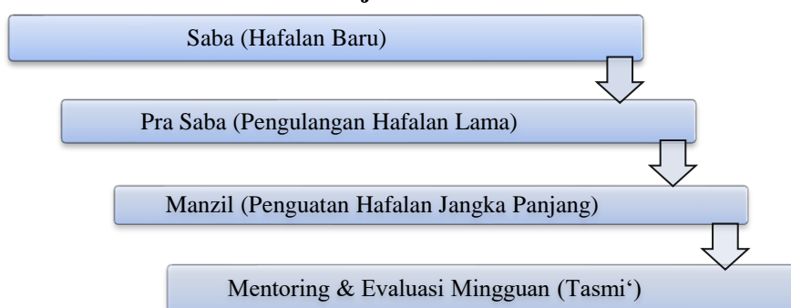
Gambar 1. Alur Sistem Pembelajaran Tahfidz di Ma'had Aman Bistari

Dengan demikian, metode tahfidz di Ma'had Aman Bistari dapat dikategorikan efektif dan adaptif terhadap konteks pendidikan modern. Kelebihanannya terletak pada fleksibilitas waktu, bimbingan personal, serta dukungan teknologi digital yang memungkinkan santri melakukan murāja'ah kapan saja. Namun, faktor penghambat tetap perlu diperhatikan, terutama jadwal vokasional yang padat dan potensi penurunan fokus belajar, sehingga diperlukan pengaturan waktu yang lebih proporsional antara aktivitas akademik dan hafalan.