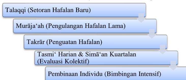
Gambar 2. Model Siklus Pembelajaran Tahfidz di Ponpes Pandanaran

Kelemahannya terletak pada kurangnya fleksibilitas dan tingginya tekanan psikologis, terutama bagi santri yang mengalami kesulitan dalam mengejar target hafalan. Oleh karena itu, meskipun metode Pandanaran terbukti efektif menjaga hafalan, tantangan ke depan adalah bagaimana mengadaptasikan aspek digital dan psikopedagogis tanpa mengurangi nilai sanad tradisional.