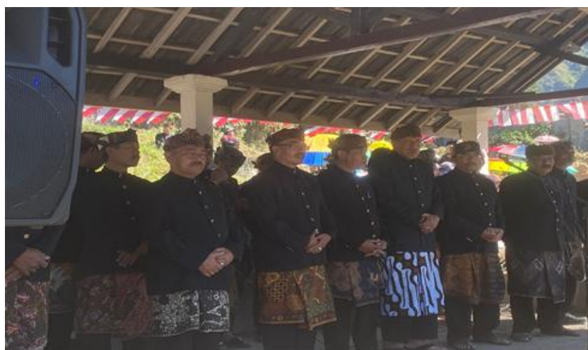
Gambar. 2 Ketua Adat dan Pemuka Adat Lainnya Menyampaikan Nasehat adat

Terlihat pada foto Gambar 1, setiap orang tua mengikutsertakan anak-anak untuk berpartisipasi pada upacara adat. Begitu pun dengan upacara adat lainnya, seperti perkawinan dan Kasada . Setiap orang tua masyarakat Tengger membiasakan anak-anaknya untuk ikut serta dalam semua rangkaian upacara adat agar upacara adat tersebut tetap lestari. Gambar di atas diambil pada puncak hari raya Karo yang ditutup dengan acara Nyadran . Upacara Hari Raya Karo atau biasa disebut upacara adat Karo ialah upacara ritual suku Tengger, yang merupakan lebaran bagi masyarakat suku Tengger. Upacara ini bertujuan kembali pada kesucian, yang disebut Satya yoga , anggapan tersebut muncul bahwa di zaman Satya yoga masyarakat bersifat suci, berpegang teguh pada kebenaran, sederhana, serta kejujuran. 11