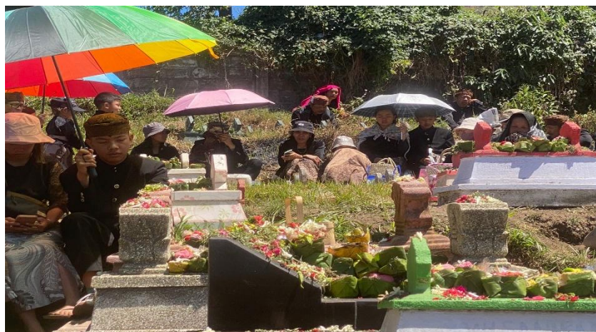
Gambar 1. Nyadaran bagian dari rangkaian hari raya Karo

Terlihat pada foto Gambar 1, setiap orang tua mengikutsertakan anak-anak untuk berpartisipasi pada upacara adat. Begitu pun dengan upacara adat lainnya, seperti perkawinan dan Kasada . Setiap orang tua masyarakat Tengger membiasakan anak-anaknya untuk ikut serta dalam semua rangkaian upacara adat agar upacara adat tersebut tetap lestari. Gambar di atas diambil pada puncak hari raya Karo yang ditutup dengan acara Nyadran . Upacara Hari Raya Karo atau biasa disebut upacara adat Karo ialah upacara ritual suku Tengger, yang merupakan lebaran bagi masyarakat suku Tengger. Upacara ini bertujuan kembali pada kesucian, yang disebut Satya yoga , anggapan tersebut muncul bahwa di zaman Satya yoga masyarakat bersifat suci, berpegang teguh pada kebenaran, sederhana, serta kejujuran. 11