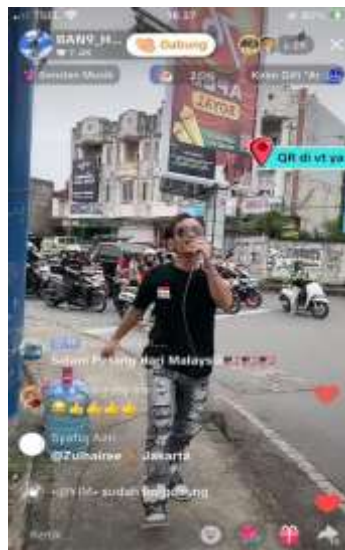
Gambar 3. Pemilik akun sedang melakukan live streaming