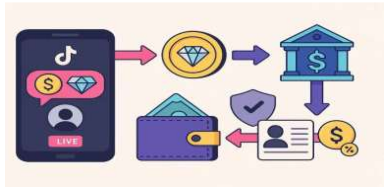
Gambar 2. Proses Pencairan Dana Gift

Setelah seluruh persyaratan terpenuhi, proses pencairan dilakukan dengan mengakses profil, kemudian masuk ke menu pengaturan dan memilih fitur saldo untuk melihat akumulasi pendapatan. Informasi terkait jumlah Berlian dan estimasi nilainya dapat ditemukan pada bagian pendapatan gift. Apabila telah memenuhi batas minimal, fitur penarikan akan tersedia dan memungkinkan pengguna menentukan jumlah dana yang ingin dicairkan, yang selanjutnya dikonversi secara otomatis ke dalam mata uang rupiah. 32 Tahap berikutnya mencakup pemilihan metode pembayaran serta verifikasi ulang data sebelum konfirmasi akhir dilakukan. Proses ini memerlukan waktu tertentu, umumnya antara satu hingga lima hari kerja, dan pengguna dapat memantau perkembangannya melalui riwayat transaksi atau menghubungi layanan bantuan apabila terjadi hambatan. 33